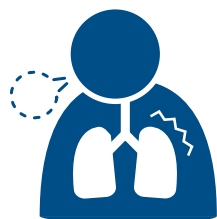
息をするのが とても 大変

● 長い 時間 治っていない 病気がある人は、具合が 悪くなったとき、 いつも 行く 病院の 医者に 電話で 相談してください。