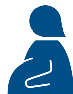
お腹に 赤ちゃんがいる人