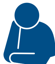
とても 疲れている